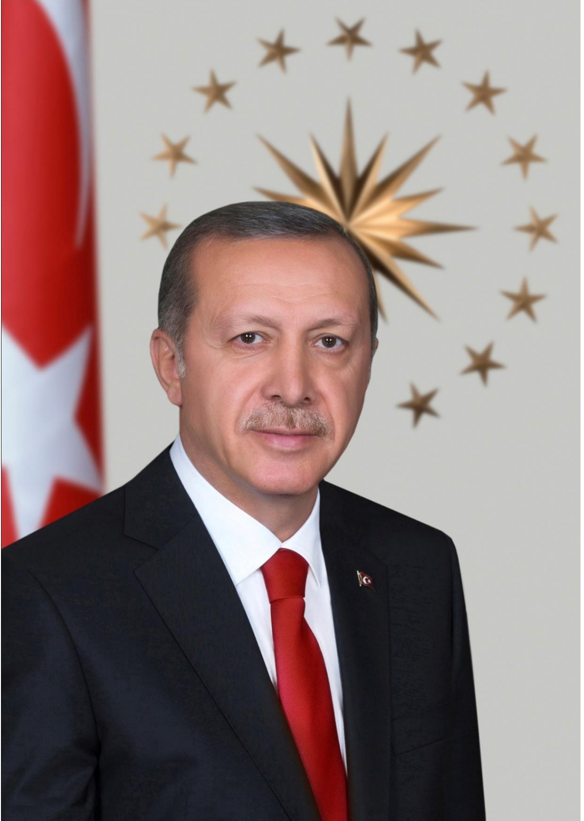
Recep Tayyip ERDOĞAN Türkiye Cumhuriyeti Cumhurbaşkanı