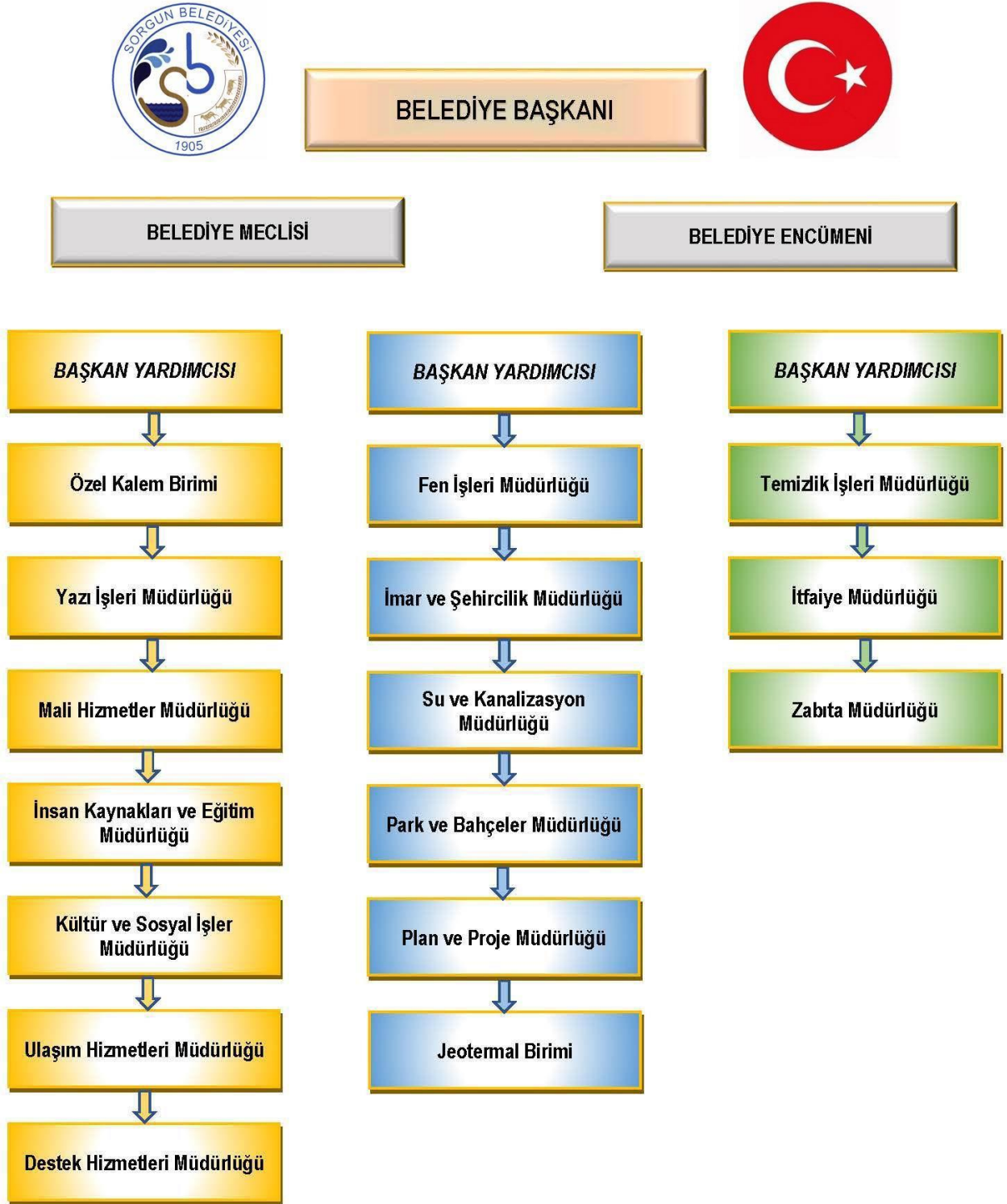
Şekil 1. Teşkilat Şeması

Sorgun Belediyesi'nin 2023 yılı itibarı ile yönetim yapısını yansıtan organizasyon şeması aşağıda yer almaktadır.